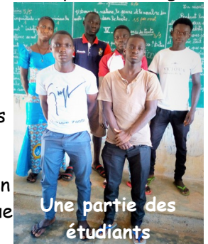
Une partie des étudiants

Le parrainage prend en charge les frais de chaque orphelin (inscription et fournitures scolaires) car l'école, au Burkina, n'est ni gratuite ni obligatoire.